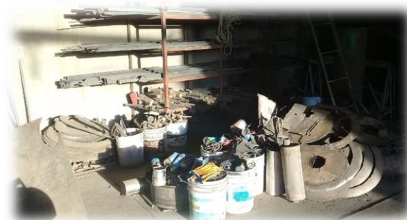
Figura 5. Después en el área de trabajo.

En el aspecto de limpieza, no solo se considera el aspecto visual y la imagen pulcra de las áreas sino lo cómodo que es tener áreas, sistemas, procesos y ambientes limpios, desde lo general hasta aquello que no se ve a la vista externa; esto incluye los aspectos éticos, actitudinales y de colaboración con la empresa, así mismo, el ambiente de trabajo será armónico si se trabaja en equipo 9 .