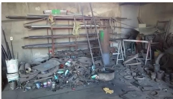
Figura 4. Antes en el área de trabajo.

obligaciones que permitan desarrollar las actividades propias de la primera fase y definir las herramientas que se van a utilizar, en función de los recursos, capacidades y habilidades disponibles. Así mismo recalando siempre al personal operativo que un espacio seguro y limpio facilita la comunicación con el resto de los empleados, porque como es sabido, los materiales, componentes y equipos que no se usan se convierten en obstáculos que dificultan las relaciones personales. Es por ello que se le planteó la importancia de los espacios libres de suciedad y despejados; ya que con esto se evitan reclamaciones de los clientes y por ende mejora la calidad de vida en el área operativa y la seguridad.