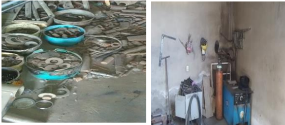
Figura 2. Áreas en las que se inician trabajos de orden.

utilización de los herramientas, así como delimitado algunas de las áreas.