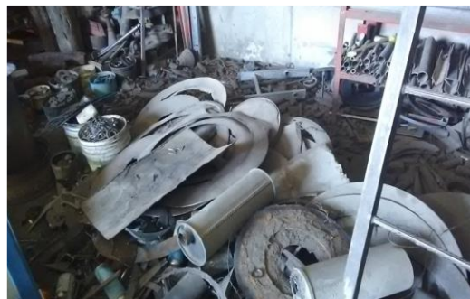
Figura 1. Área de trabajo sin organización, ni orden ni limpieza.

La figura 1 muestra un área operativa de trabajo que no tiene implantada ninguno de los elementos característicos que conforman la metodología 9s's. Dentro de algunos de los objetivos de estas herramientas Lean son crear un lugar de trabajo eficiente, empleo de la limpieza para comprobar las deficiencias de funcionamiento, establecer controles visuales, mejorar la estandarización y las preparaciones, acciones de carácter preventivo, capacitación de trabajadores competentes en sus equipos y promover las ventas. En base al diagnóstico inicial efectuado en la empresa RIESA, se le planteó al gerente la importancia de la implantación de esta metodología, teniendo como principal objetivo a alcanzar, la organización.